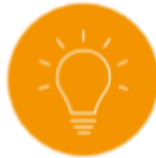
Ruimte voor talent van ieder kind